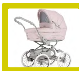
CARRINHO DE BEBÉ COM ASSENTO FIXO

As autoridades nacionais concordaram em limitar o âmbito desta atividade aos carrinhos de bebé destinados a crianças com peso inferior a 15 kg (incluindo qualquer plataforma integrada sobre a qual uma criança com peso inferior a 20 kg possa ficar de pé) abrangidos pela norma EN 1888-1. Foram incluídas na amostra quatro categorias: carrinhos de bebé com assento fixo; carrinhos de bebé com assento duplo ou reversível; carrinhos de bebé com sistema (trio ou mais configurações); carrinhos de bebé com mais de nove configurações.