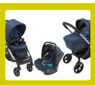
CARRINHO DE BEBÉ COM SISTEMA (TRIO OU MAIS CONFIGURAÇÕES)