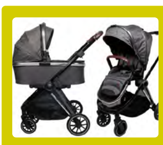
CARRINHO DE BEBÉ DUPLO OU REVERSÍVEL