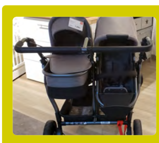
MAIS DE NOVE CONFIGURAÇÕES