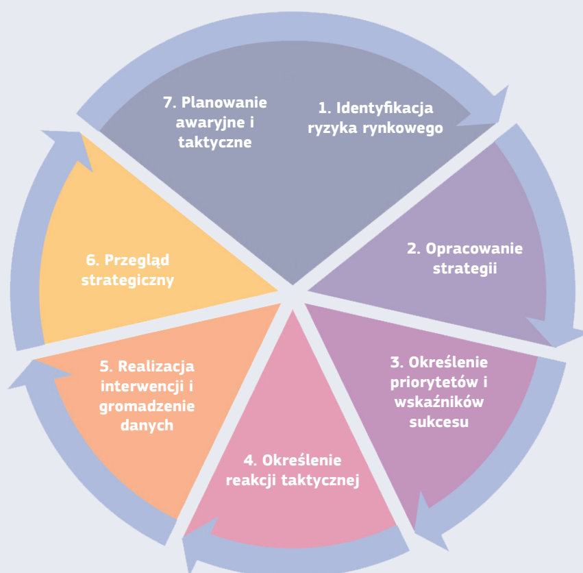
Rysunek 2 - Strategiczne kroki działania ORZN

Opracowano siedmioetapowe podejście , które można wykorzystać do prowadzenia strategicznego działania ORZN.