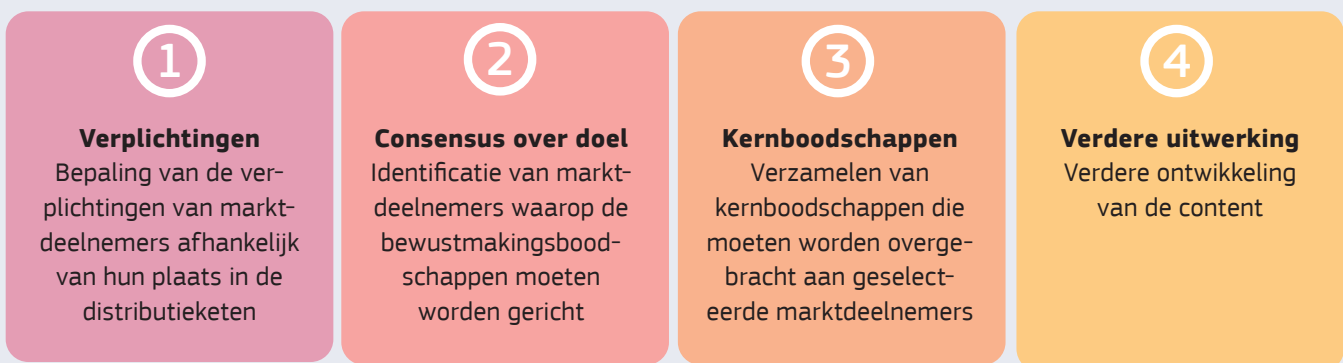
Figuur 2 - Ontwikkeling van de content voor de infographics

Nadat ze de belangrijkste verplichtingen hadden vastgesteld, bepaalden de deelnemers aan de activiteit de specifieke marktdeelnemers op wie ze zich moesten richten (verkopers op straatmarkten) en verzamelden ze tijdens bijeenkomsten en door het gebruik van digitale samenwerkingstools zoals Mural 1 en raadplegingen op het Wiki-platform een aantal boodschappen om over te brengen. Nadat een beslissing was genomen over de kernboodschappen, werd de content verder ontwikkeld door specifieke details, belangrijke definities en relevante links toe te voegen. Daarnaast gaf Etsy (een marktplaats van derden die het voor thuiswerkende fabrikanten mogelijk maakt om online te verkopen) ook feedback op de ontwikkelde berichten.