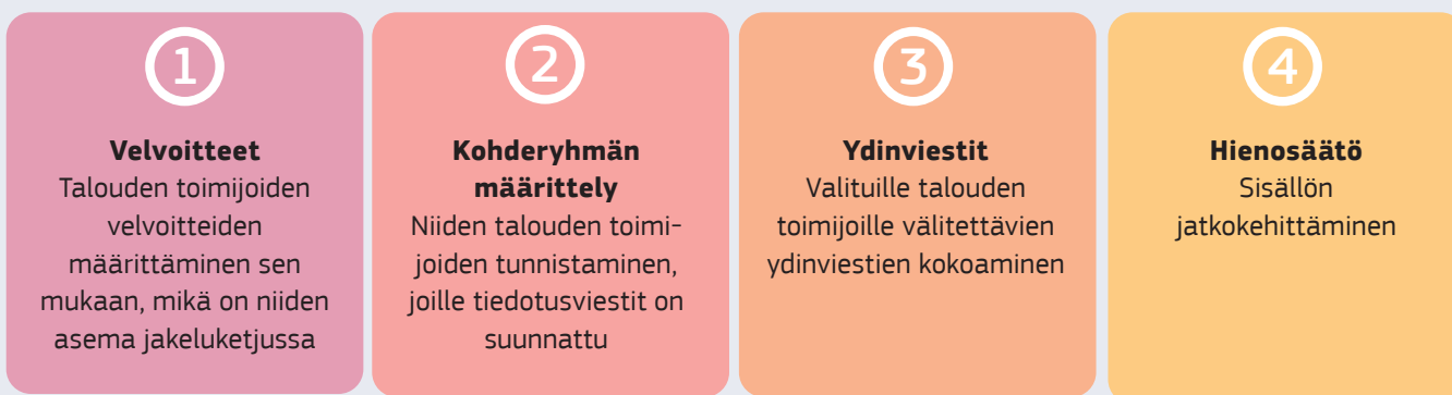
Kuva 2 - Infografiikan sisällön kehittäminen

Keskeisistä velvoitteista päätettyään toimeen osallistajat päättivät, mille talouden toimijoille (katu- ja torikauppiat) toimi kohdistetaan. Lisäksi he keräsivät välitettäviä viestejä kokousten aikana sekä digitaalisia viestintävälineitä, kuten Muralia 1 ja Wiki-palvelussa suoritettuja kuulemisia, käyttämällä. Kun ydinviesteistä oli päätetty, sisältöä kehitettiin edelleen lisäämällä siihen yksityiskohtia, tärkeitä määritelmiä ja asiaankuuluvia linkkejä. Lisäksi Etsy (kolmas osapuoli, markkinapaikka, joka kotoa käsin toimivien valmistajien voidaan myydä tuotteitaan verkossa) antoi myös palautetta kehitetyistä viesteistä.