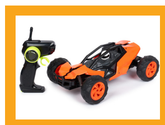
HRAČKY NA DIAĽKOVÉ OVLÁDANIE

Táto činnosť bola zameraná na elektrické hračky. Výrobky sa testovali podľa spoločne dohodnutých kritérií v akreditovanom európskom laboratóriu.