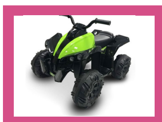
ELEKTRICKÉ HRAČKY NA JAZDENIE