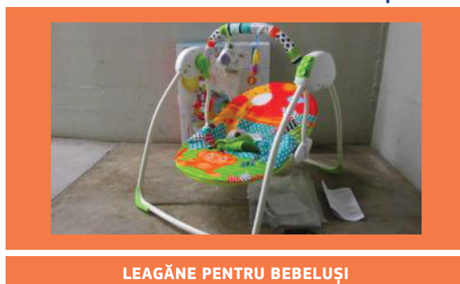
LEAGĂNE PENTRU BEBELUȘI

Această activitate s-a axat pe două categorii de articole de îngrijire a copiilor, eșantionate și testate în conformitate cu criteriile stabilite de comun acord într-un laborator acreditat la nivel european.