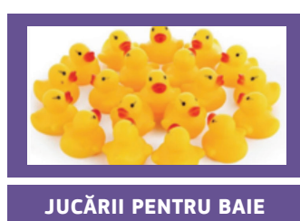
JUCĂRII PENTRU BAIE