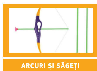
ARCURI ȘI SĂGEȚI

Această activitate CASP specifică produselor s-a axat pe jucăriile provenite de la magazinele online din afara UE și de la vânzătorii din afara UE de pe piețele online, care au fost identificate de autoritățile de supraveghere a pieței ca fiind o prioritate pentru o anchetă țintită privind siguranța.