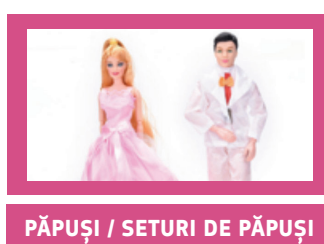
PĂPUȘI / SETURI DE PĂPUȘI