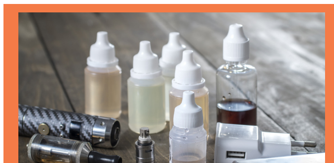
PŁYNY DO E-PAPIEROSÓW

Działanie to koncentrowało się na e-papierosach (urządzenia jednorazowego użytku, urządzenia wielokrotnego ładowania o różnych rozmiarach) oraz płynach do e-papierosów zawierających nikotynę i niezawierających nikotyny.