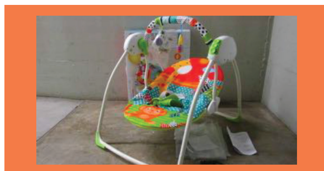
HUŚTAWKI DLA NIEMOWLĄT

Działanie to koncentrowało się na dwóch kategoriach artykułów do pielęgnacji dzieci, z których pobrano próbki i zbadano je zgodnie z powszechnie przyjętymi kryteriami w akredytowanym laboratorium europejskim.