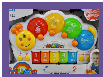
ZABAWKI ELEKTRYCZNE Z OGNIWAMI GUZIKOWYMI/ INNYMI OGNIWAMI