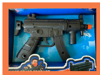
ZABAWKI ELEKTRYCZNE Z LASERAMI/INNYMI ŚWIATŁAMI