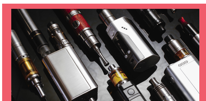
DISPOSITIVI DELLE SIGARETTE ELETTRONICHE