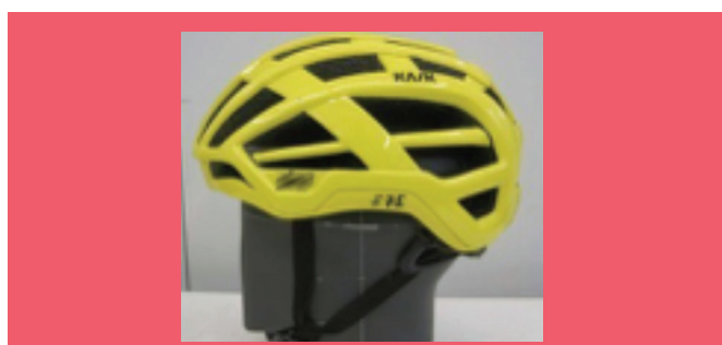
KACIGE ZA BICIKLISTE I ZA KORISNIKE KOTURALJKI ILI DASKI NA KOTURALJKAMA