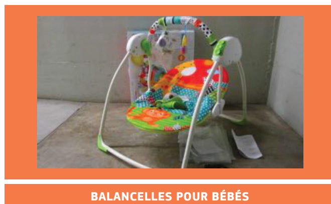
BALANCELLES POUR BÉBÉS

Cette activité s'est concentrée sur deux catégories d'articles de puériculture, échantillonnés et testés selon des critères convenus d'un commun accord dans un laboratoire européen accrédité.