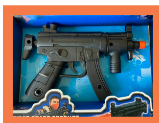
ELEKTRILISED MÄNGUASJAD LASERITE / TEISTE VALGUSTITEGA