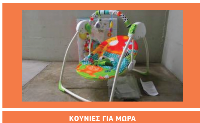
ΚΟΥΝΙΕΣ ΓΙΑ ΜΩΡΑ

Η δράση αυτή επικεντρώθηκε σε δύο κατηγορίες ειδών παιδικής φροντίδας, για τα οποία ελήφθησαν δείγματα και ελέγχθηκαν σύμφωνα με κοινά συμφωνημένα κριτήρια σε ευρωπαϊκό διαπιστευμένο εργαστήριο.