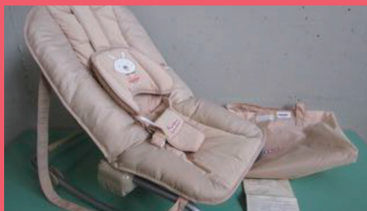
ШЕЗЛОНГА ЗА МАЛКИ ДЕЦА