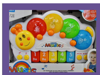
ЕЛЕКТРИЧЕСКИ ИГРАЧКИ С БАТЕРИИ ТИП „МОНЕТА“/ДРУГИ БАТЕРИИ