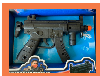
ЕЛЕКТРИЧЕСКИ ИГРАЧКИ С ЛАЗЕРИ/ ДРУГИ СВЕТЛИНИ